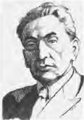
Юліан Вассіян (1894–1953)

тривання засобом найінтенсивнішого виявлення духово-культурного впливу в часі»). Якраз друга проекція й становить історичне поле буття нації 39 . Отже, історичність приховується не в просторовій, а у вольовій сфері людини. На відміну від містичних та метафізичних моментів тлумачення походження волі в А. Шопенгауера чи Ф. Ніцше єдиним джерелом волі у Вассіяна є не якісь зовнішні детермінанти, а сама людина.