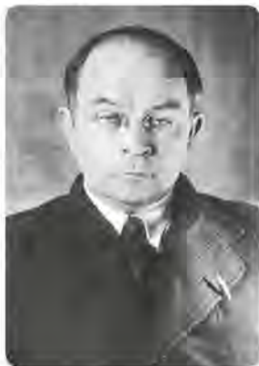
Віктор Петров (1894–1969)

Екзистенціальне переживання Петровим своєї історичної ситуації поєднується із усвідомленням того факту, що причиною деградації культури є технічний прогрес. Розуміння кризового стану сучасного йому суспільства розгортається пізніше у концепцію культурно-історичних епох . Дроблення (членування лінії часу) на епохи, періоди обумовлене необхідністю виділити значуще в минулому для сучасності. Взагалі, періодизація постає як засіб для структурування потоку часу. Впорядковуючи емпіричний матеріал, історики вибудовують у хронологічному порядку історичні періоди, часто відповідаючи часто на певні запити екзистенції самих істориків. Для Петрова історичний процес — це перебіг послідовності певних культурно-історичних відтинків, що зумовлені дискретністю часу. Кожен такий відтинок (епоха) має свої кризові стани. Головною ознакою кризи сучасної доби він називає почуття « несталості » особистості, що проявляється у суцільній релятивізації. Релятивізм — породження руйнівної сили техніки — призводить до стану перманентної втоми від плуралізму дріб'язкових істин, відсутності чітких моральних критеріїв.