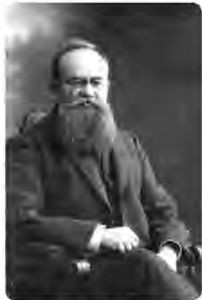
Михайло Грушевський (1866–1934)

Ці фактори виконують змушуючий вплив на виникнення найрізноманітніших фактів історичного знання (соціальних, політичних, культурних). Як видно, у Грушевського не було їх жорсткого і сталого набору як якоїсь постійної детермінанти історичного розвитку. У своїх працях він говорить про найрізноманітніші фактори як рушійні сили історичного життя. Та й відносно самого історичного процесу потрібно також говорити про несталість і про домінування на різних етапах історичної еволюції різних змушуючих факторів. Він схиляється до думки, що ідея багатofакторності повинна пояснювати не весь історичний процес, а лише окрему історичну епоху чи конкретну історичну ситуацію. Тут історика повинно турбувати лише те, чи з достат-