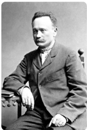
Іван Франко (1856–1916)

За першим іде другий період, який він, за Спенсером , називає періодом «панування церемоній та обрядів» . «Боротьба за існування витворює спільність. Спільність витворює обряди, церемонії та вірування, котрі її зміцнюють. Обряди, церемонії та вірування, розростаючись чимраз більше, витворюють окрему верству людей «відущих» (ворожбитів, лікарів, попів), а посередньо витворюють абсолютних владців з дідичною (не народною, а протинародною) властю. Абсолютна власть обалює і нищить первісну спільність. Те, що в початку зміцнювало спільність, в дальшому розвитку нищить її, — розуміється, не зовсім, нищить тільки одну форму спільності, щоб впровадити другу. Се немов образ того змія, що кусає власний хвіст, але іменно се, як побачимо далі, і є загальний закон історичного розвитку, принаймні в дотеперішній історії» .