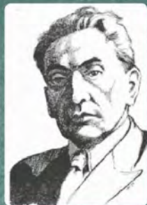
Юліан Васильян (1894–1953)