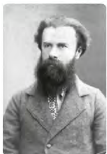
Михайло Драгоманов (1841–1895)