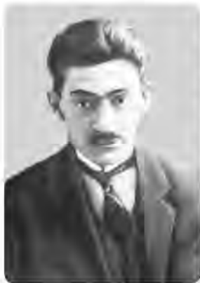
Дмитро Донцов (1883–1973)

Творча меншість має принципово інше світовідчуття, ніж пасивна більшість. Зоологічна воля до життя, до влади, до експансії — ось риси психіки еліти. Звідсіля сліпа віра, фанатизм та аморальність як головні практичні вимоги для послідовників цієї ідеології. Донцовський вольовий (чинний) націоналізм — це ідеологічна доктрина, що базується на суто ірраціональних началах. Зауважимо, що розуміння Донцовим категорії волі як основоположної для своєї доктрини є вельми специфічним. Воля для нього (як і для його вчителя Шопенгауера ) — це феномен інстинктивний, неусвідомлюваний. Це воля до життя «без санкцій, без оправдання, без умотивування».