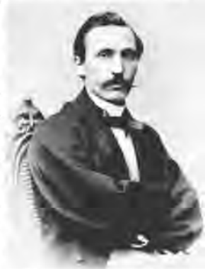
Пантелеймон Куліш (1819–1897)

Саме « вкоріненість » шукали ідеологи романтизму в духовних термінах через внутрішню відповідність між індивідом, рідним ґрунтом, народом та богом/космосом. Потрібно нагадати, що пізніше ідеї романтиків знайшли своє відображення в культурфілософа Освальда Шпенглера (1880–1936), коли він у « Присмерках Європи » (1918–1922) протиставив концепти культури та цивілізації. Культура має душу, а цивілізація ж є найбільш зовнішнім і штучним станом, на який здатне людство. Отже, прийняття культури означає вкоріненість у неї, що й приводить до подолання стану відчуження від природи та суспільства. « Органічна » єдність всіх складників культури є явище антицивілізаційне, але й антивідчужуюче.