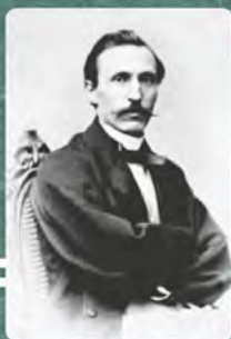
Пантелеймон Куліч (1819–1897)

(середина XIX — перша половина XX століття)