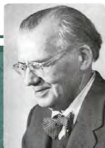
Дмитро Чижевський (1894–1977)