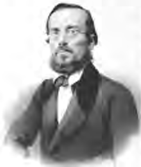
Микола Костомаров (1817–1885)

єю душі потрібно мабуть шукати у глибокому розладі на рівні романтичного світогляду між ідеалом і тогочасною дійсністю. Неприйняття романтиками оточуючої реальності приводить до того, що за цією реальністю вони починають відкривати глибинні шари іншої, «правильної реальності».