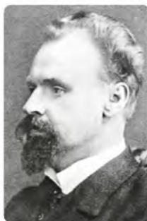
Богдан Кістяківський (1868–1920)