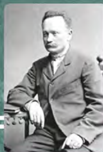
Іван Франко (1856–1916)