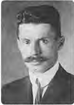
В'ячеслав Липинський (1882–1931)

Стихийний потяг до влади, до панування провідної верстви тягне за собою з необхідністю і волю до ризику та самопожертви. У свою чергу, такі риси станового характеру провідної верстви були б неможливі без наявності «внутрішньої сили», що і зумовлює авторитет її влади у свідомості пасивної більшості («... за упадком внутрішньої сили правлячої меншості йде неодмінно упадок її влади»). Крім морального авторитету, однією з головних рис провідної верстви слід назвати «матеріальну силу». Якщо моральний авторитет передбачає вміння організовувати владу таким чином, щоб в