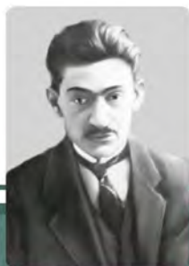
Дмитро Донцов (1883–1973)