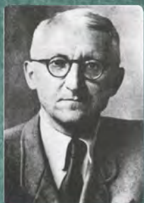
Микола Шлемкевич (1894–1966)