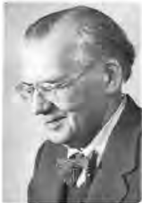
Дмитро Чижевський (1894–1977)

При цьому виразно проглядається, як уже зазначалося, що підґрунтям рефлексій над історичним виміром людського буття у Чижевського є гегелівська теорія історичного процесу (принаймні це твердження правильне для 20–30 рр.). До ідеї світового духу, який у певний проміжок часу робить, так би мовити, ставку на той чи інший народ/націю, знаходячи у ньому найвище для певного етапу вираження і стаючи «духом народу», Чижевський ставиться досить прихильно. Цей «історичний «дух»... — пише він, — виконує свою історичну місію, ніби доорчуваючи її виконання в окремі історичні