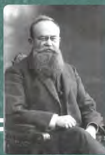
Михайло Грушевський (1866–1934)