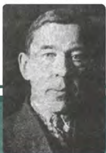
Володимир Юринець (1891–1937)