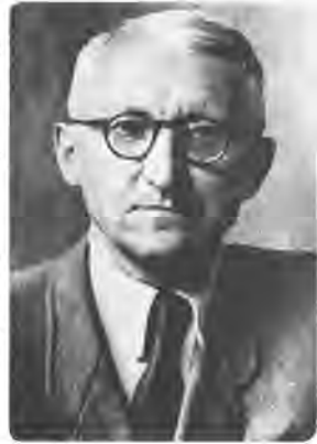
Микола Шлемкевич (1894–1966)

Непевність екзистенції вкорінена в умові історії — мінливому часі. Початкова свобода екзистенції, що існує в часі, породжує такі стратегії проживання в ньому, що можуть бути названі розмаїттям можливостей . Екзистенція існує в умовах, коли завжди є можливість зберегти себе або загинути, оновитися або розпастися. Всі аспекти зміни в часі — це реалізація певної можливості. Причому можливість завжди є відкритістю в майбутнє. У свою чергу, реалізація можливості в майбутньому можлива завдяки відкритості цієї можливості в минулому. Майбутнє завжди проблематично прикріплене до минулого в точці тепер . Теперішні можливості — це перспектива на майбутнє, яка вкорінена в минулому. Тобто можливість як проект майбутнього містить у собі певний образ минулого. Як писав із цього приводу все той же правий інтелектуал Юліан Васснян : «Ми ж маємо перед собою власну майбутність і тому минуле досліджуємо не з уваги на нього самого, але головно з уваги на спосіб вияву своєї волі в будові дальших ланок історії» .