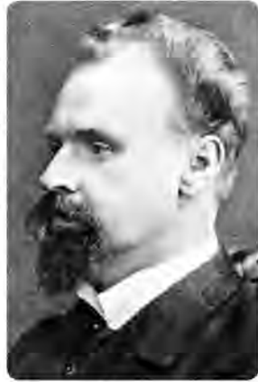
Богдан Кістяківський (1868–1920)

Звідси — й різні способи «роботи» із цими двома сферами, тепер уже у неокантіанстві. До сфери природи розум може застосувати категорію закону. Закон — це те, що відбувається з необхідністю, він є вираженням необхідності. Сфера ж власне не природного (штучного, результату людських діянь) у людині вимагає застосування зовсім іншого методологічного інструментарію, який би дозволив «схопити» цей рівень позаприродного. У лідерів баденської школи неокантіанства — В. Віндельбанда та Г. Рікєрта — ці методологічні підходи називаються, відповідно, ідіографічним та індивідуалізуючим , і результатом