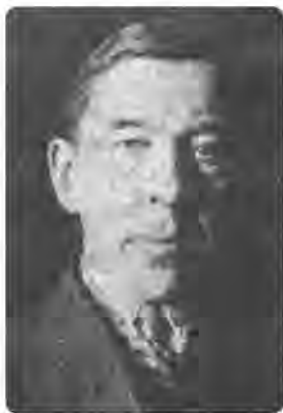
Володимир Юринець (1891–1937)

Ідеологія як система раціоналізованих уявлень про суспільство, що ще й виправдовує та легітимізує конкретний соціальний порядок має двосторонні « відносини » з економічним базисом: крім того, що ідеологічні феномени можуть мати самостійне значення вона ще мати й зворотній вплив на економіку. Тому розуміння надбудови та ідеології як її складової лише як одновекторного відображення економіки у духовні форми, як своєрідної « фотографії » економічного базису Юринець характеризує як « сплутування детермінізму з фаталізмом ».