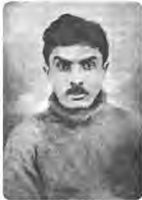
Микола Хвильовий (1893–1933)

Хвильовий — українець, комуніст і, врешті, європеєць. І ці три складники його ідентичності, злиті в суперечливе ціле, породили амбівалентність світогляду, яка так добре відчувається в його публіцистиці. У своєму забороненому за життя памфлеті «Україна чи Мало-росія?» Хвильовий, наслідуючи ідеї Освальда Шпенглера (1880–1936) 52 , твердить, що «кожний народ переживає дитинство, культурний етап і цивілізаційний... Цивілізаційний етап і на наш погляд є останній акорд всякої культури і початок її кінця» . Проте далі він іде на компроміс, поєднуючи історизм і під-