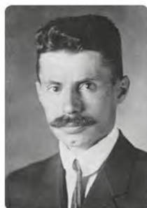
В'ячеслав Литинський (1882–1931)