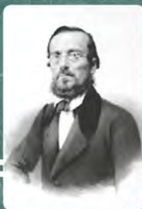
Микола Костомаров (1817–1885)