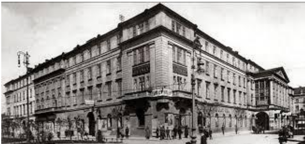
Рис. 5. Новий Львівський театр 1920-ті рр.