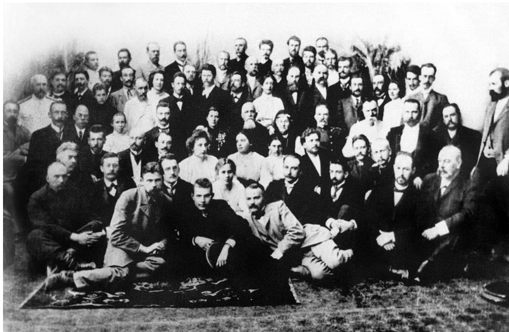
Рис. 1. Діячі культури та представники громадськості (1920-ті рр.)