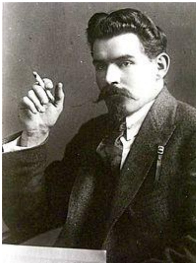
Рис. 2. О. Шумський (1890–1946 рр.)