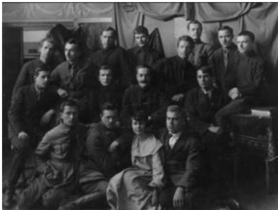
Рис. 4. Літературне об'єднання селян-письменників «Плуг» (1920-ті рр.)