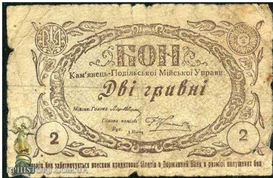
Рис. 8. Фото-цинкографія. І. Гутман. Кам'янець-Подільський (1919 р.)