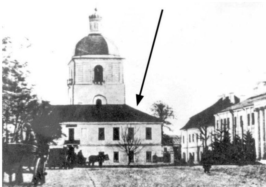
Рис. 10. Кам'янець-Подільський комітет охорони пам'яток старовини, мистецтва та природи (1920-ті рр.)