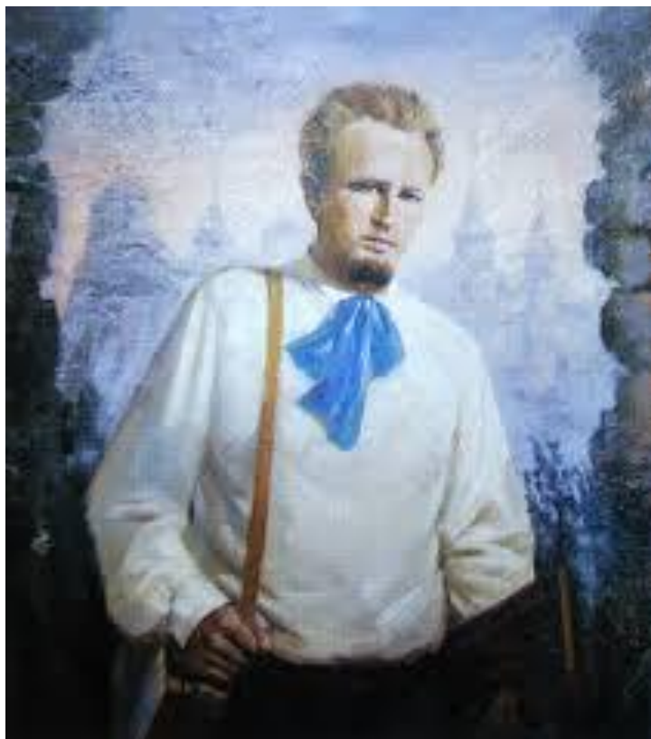
Рис. 9. В. Гагенмейстер (1887–1938 гг.)