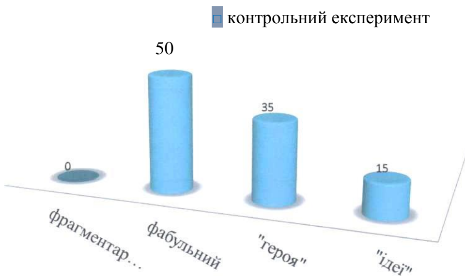
Рис. 2.2. Розподіл рівнів комунікативних умінь учнів четвертого класу на етапі контрольного експерименту

Знаючи ці дані, ми можемо знайти загальну суму балів, одержаних за відповіді на питання і самостійно поставлені запитання учнів до тексту художнього твору. Це дасть змогу остаточно визначити рівні комунікативних умінь учнів четвертого класу.