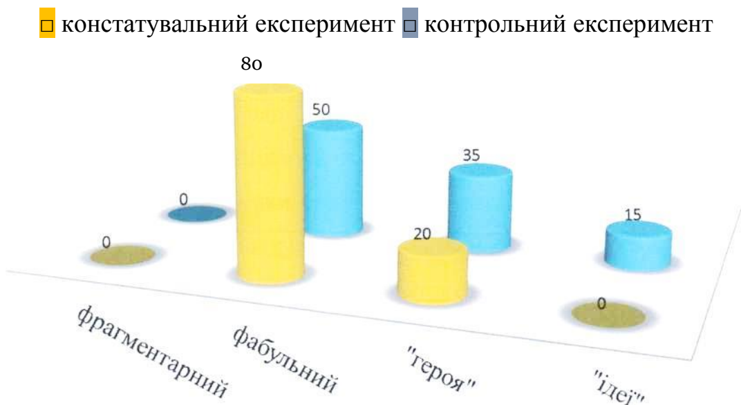
Рис.2.3. Динаміка розвитку рівнів комунікативних умінь учнів четвертого класу

Наочно представимо результати експерименту на констатувальному та контрольному етапах на рис. 2.3.