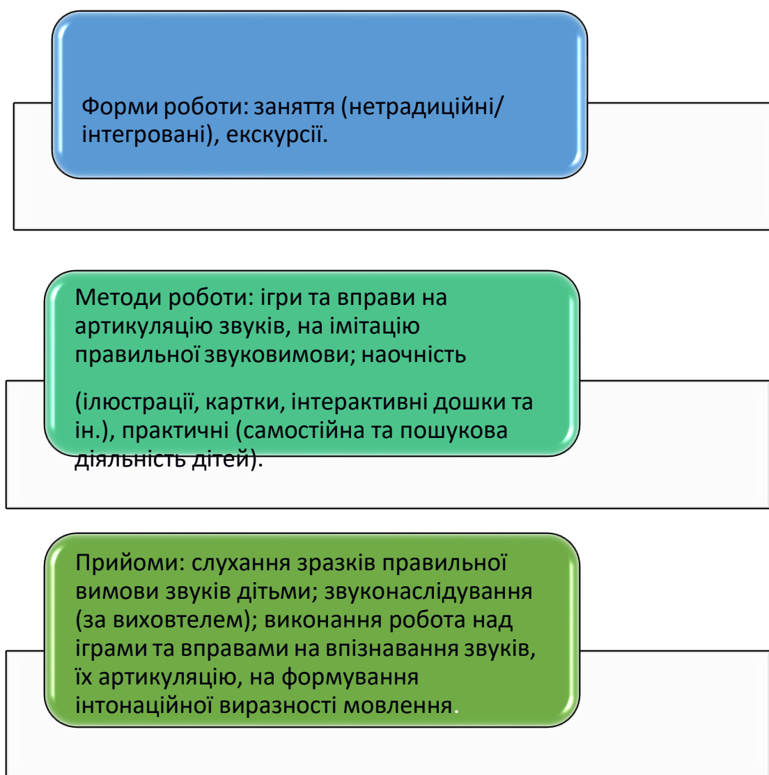
Рис. 2.11. Форми, методи та засоби організації діяльності вихователя ЗДО із розвитку мовлення в дітей раннього віку.

Рекомендовані нами форми, методи та прийоми із виховання правильної звуко- та слововимови в дітей 2-3 років засобами дидактичних ігор і вправ унаочнені на рис.2.11.