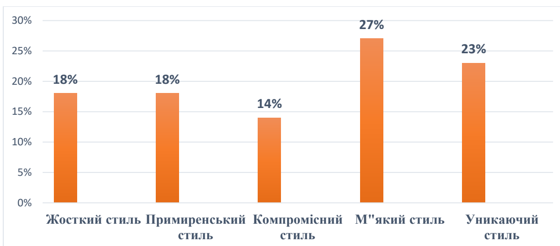
Рис. 2.1. Стиль поведінки у конфліктних ситуаціях

Отже, можна зробити висновок, що в учнів четвертого класу переважають м'який та уникаючий стилі поведінки у суперечках, тобто вони прагнуть не загострювати конфліктну ситуацію, відкласти її розв'язання, перекласти її вирішення на сторонніх осіб чи то використовують інші шляхи. Це впливає на розвиток їхньої особистості та визначає взаємодію зі спільнотою ровесників.