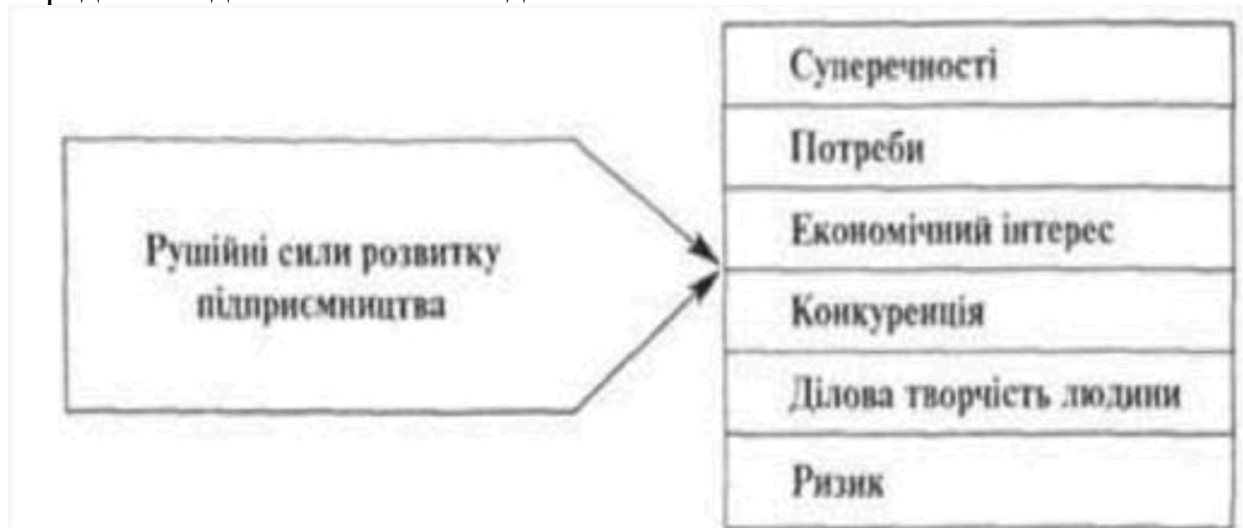
Рис. 1. Рушійні сили підприємництва

Підприємець – це людина, яка здійснює самостійну, систематичну, ініціативну, ризикову діяльність, спрямовану на виробництво товарів та надання послуг з метою одержання прибутку або особистого доходу і передбачає здійснення нововведень.