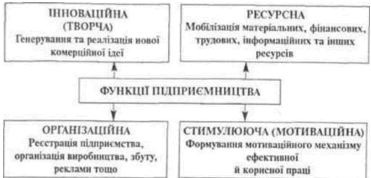
Рис. .2. Функції підприємництва

Ризикова функція підприємця полягає в необхідності прийняття рішень, які спрямовані на досягнення успіху. Підприємець ризикує не лише своєю власністю, вкладеними коштами, а й своєю працею, часом, діловою репутацією.