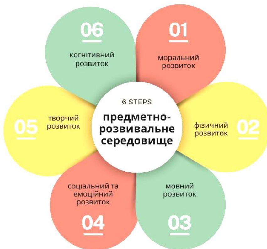
Рис. 2.1. Модель предметно-розвивального середовища

Аналіз психолого-педагогічних досліджень дозволив визначити особливості організації предметно-розвивального середовища в групах дітей раннього віку. Предметно-розвивальне середовище справляє формуючий вплив на всі сторони розвитку дитини: розумову, фізичну, моральну, естетичну, тому що дитина не тільки пізнає предмети, опановує діями з предметами, засвоює їх назви.