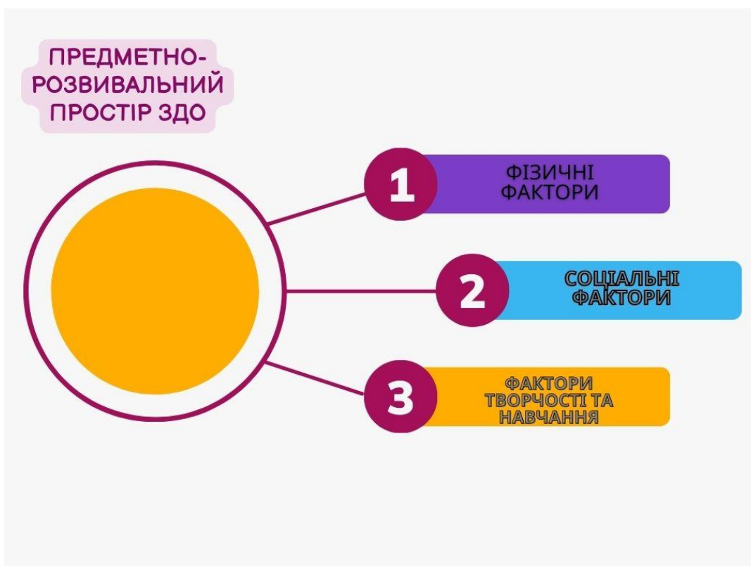
Рис. 1 Модель предметно-розвивального простору ЗДО

Фізичне середовище предметно-розвивального середовища включає планування та структурування, зонування групи. Це те, як ми розставляємо меблі та навчальні ресурси в групі, які сприятимуть навчанню дітей.