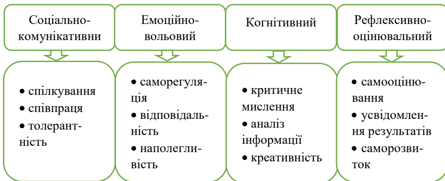
Рис. 3 Наскрізні вміння

Рисунок відображає інтегративний характер soft skills, що формуються у взаємодії знавчальною, виховною та розвивальною діяльністю в умовах позашкільної освіти.