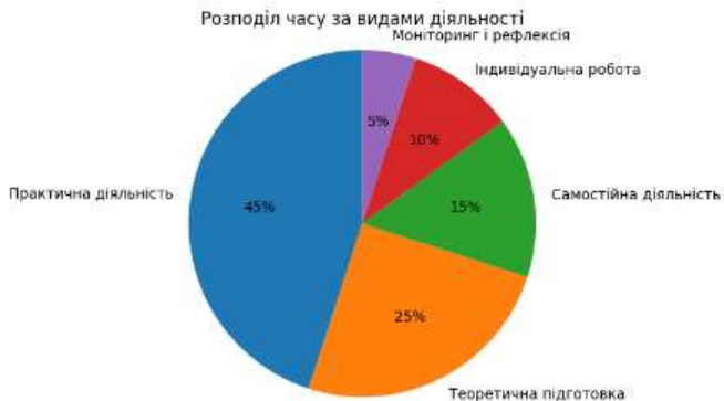
Рис.1 Структура розподілу часу за видами діяльності

Примітка: «+» — низький рівень реалізації; «++» — середній; «+++» — високий.