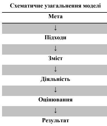
Рис. 2. Схематичне узагальнення моделі

Запропоновані таблиці, схеми та авторська модель дозволяють системно осмислити процес формування наскрізних умінь (soft skills) у молодших школярів і забезпечують науково-методичну цілісність змістового модуля.