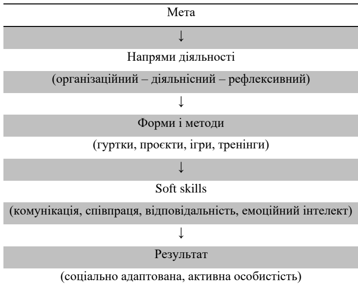
Рис. 6. Зміст практичної діяльності педагога позашкільного закладу

Отже, зміст практичної діяльності педагогів позашкільних навчальних закладів у процесі формування наскрізних умінь у молодших школярів є багатовимірним і системним. Його ефективна реалізація забезпечує гармонійний розвиток дитини, формування життєво важливих soft skills та створює умови для успішної соціалізації й особистісного зростання в сучасному суспільстві.