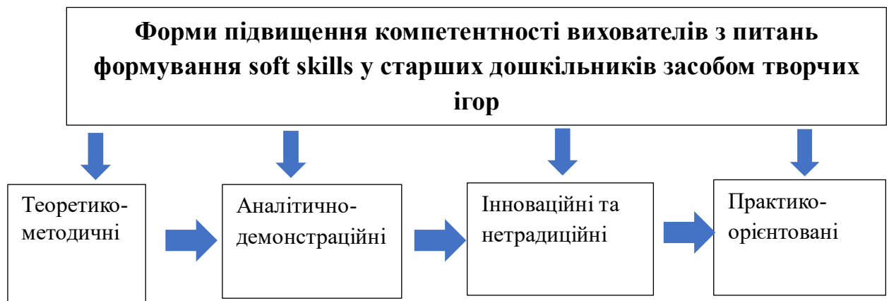
Малюнок 2.2. Форми роботи з вихователями

Графічно робота з вихователями може бути представлена такою схемою (Малюнок 2.2)