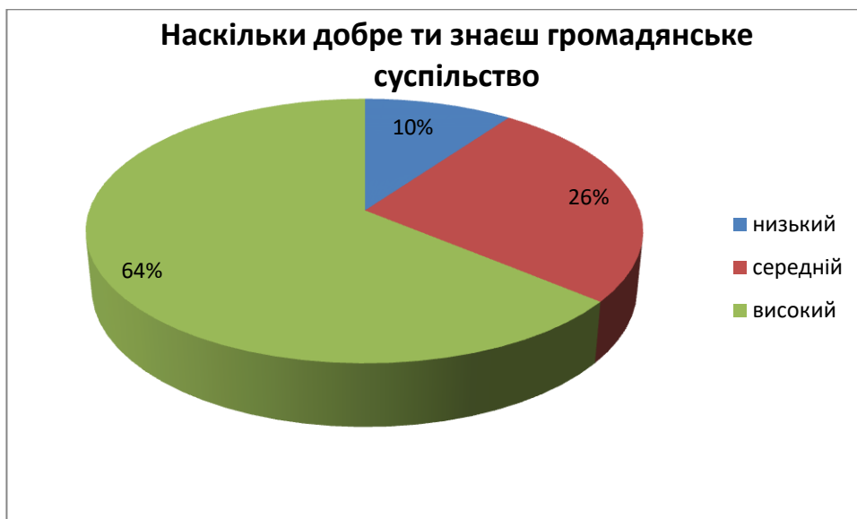
Рис 3. Результати дослідження щодо виявлення розуміння громадянського суспільства

На наступне опитування стосувалося наскільки добре студенти знають громадянське суспільство (рис.2)