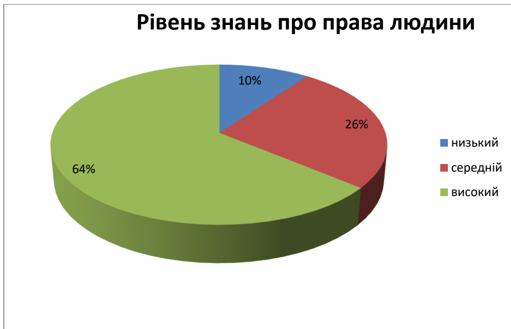
Рис 2. Результати дослідження щодо виявлення рівня знань про права людини

Результати дослідження стверджують, що сучасна молодь має поняття про права і