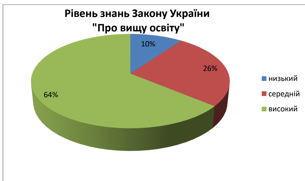
Рис 4. Результати дослідження щодо виявлення рівня знань Закону України «Про вищу освіту»

Так, як основними учасниками нашого дослідження були майбутні педагоги професійного навчання нам було цікаво розуміти наскільки вони володіють нормативною базою своєї майбутньої професійної діяльності, тому розробили тест на виявлення знань Закону України «Про вищу освіту» (рис.4).