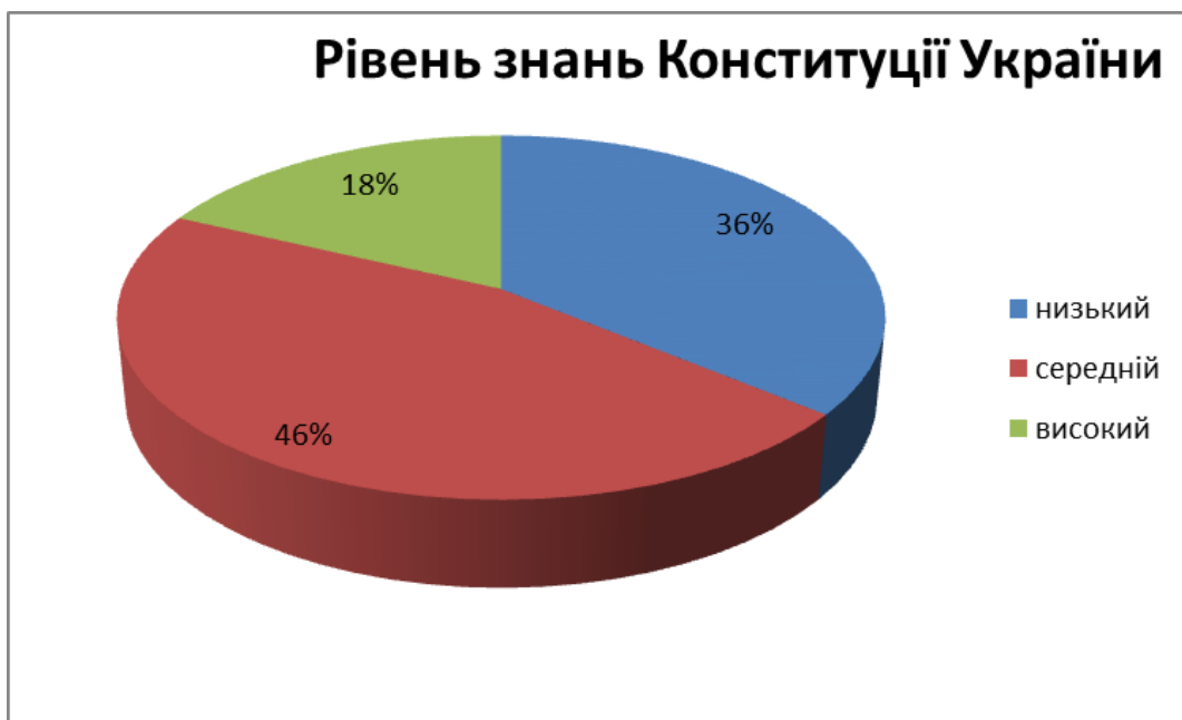
Рис 1. Результати дослідження щодо виявлення рівня знань Конституції України

Першим аспектом, який ми хотіли дослідити це правосвідомість молоді. Оскільки ми переконані, що від усвідомлення молоддю того, що їхня поведінка і діяльність має відповідати існуючим правилам і нормам (зокрема, чинним законам), ознакам справедливості й порядку, знання громадян про норми суспільного регулювання. В громадянській освіті основними стратегічними напрямками є: правова освіта громадян, зокрема в частині розуміння та вміння реалізовувати власні конституційні права та обов'язки та готовність їх відстоювати. Третина опитаних упевнені, що більшість молодих людей обізнана з правами і свободами людини. Водночас опитування проведені нами засвідчують наступне (рис. 1):