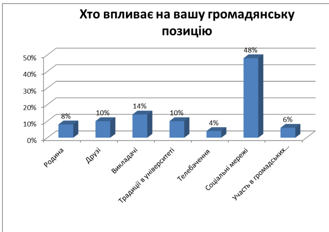
Рис. 6. Результати дослідження щодо впливу на громадянську позицію студента

університету — 10%, участь у громадських організаціях — 6%, друзі — 10%, викладачі — 14%, соціальні мережі — 48%. Якщо врахувати, що вплив родини, викладачів, друзів на формування поглядів молодих людей ще є актуальним, і як правило є головним імпульсом в обміні поглядами, проте молодь надає пріоритету соціальним мережам.