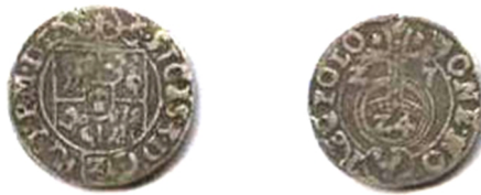
Річ Посполита, Сигізмунд III (1587 – 1632), Півторак коронний, 1627 р.