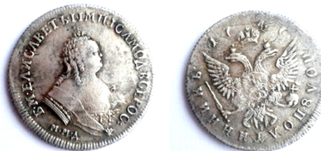
Російська імперія, срібна полуполтина Єлизавети Петрівни (1741 – 1761), 1741 р.