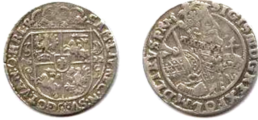
Річ Посполита, Сигізмунд III Ваза (1587 – 1632), орт коронний, 1622 р.