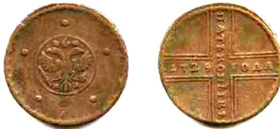
Росія, Петро II (1727 – 1730), п'ять копійок, мідь 1729 р.