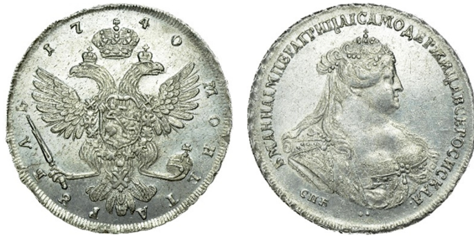
Російська імперія, срібний рубль Анни Іоанівни (1730 – 1740), 1740 р.