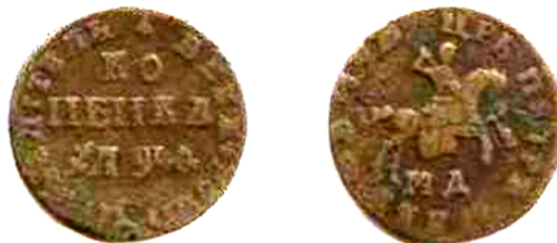
Московія, Петро I (1682 – 1725), копійка, мідь, поч. XVIII ст.