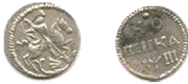
Московія, Петро I (1682 – 1725), копійка 1718 р.