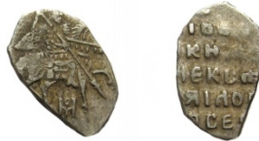
Московське царство, срібна копійка Олексія Михайловича (1648 – 1676), б.д.