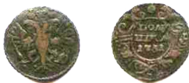
Полушка, мідь, Анна Іванівна (1730 – 1740), 1731 р.