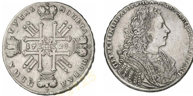
Російська імперія, срібний рубль Петра II (1727 – 1730), 1728 р.