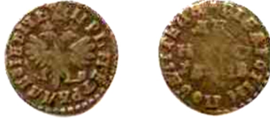
Московія, Петро I (1682 – 1725), денга (1/2 копійки), поч. XVIII ст.