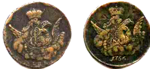
Копійка, мідь, Росія, Єлизавета Петрівна (1741 – 1761), 1756 р.