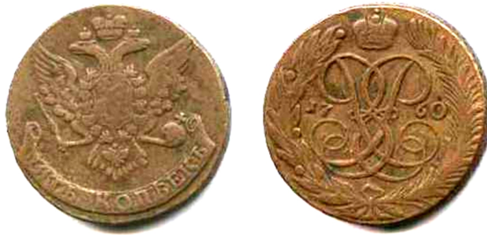
П'ять копійок, мідь, Єлизавета Петрівна (1741 – 1761), 1760 р.