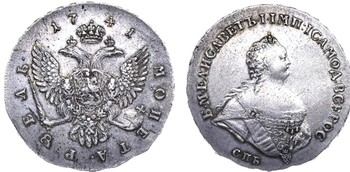
Російська імперія, срібний рубль Єлизавети Петрівни (1741 – 1761), 1741 р.