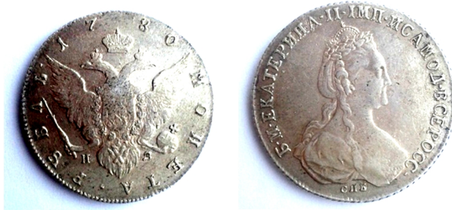
Російська імперія, рубль Катерини II (1762 - 1796), 1780 р.

Додаток Є. Окремі знахідки монет на місці ярмарку Глухівського Петропавлівського монастиря