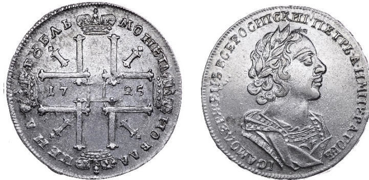
Російська імперія, срібний рубль Петра I (1682 – 1725), 1725 р.