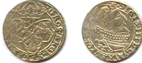
Річ Посполита, Сигізмунд III (1587 – 1632), Шостак коронний, 1620 р.