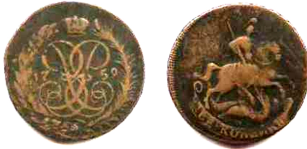
Дві копійки, мідь, Єлизавета Петрівна (1741 – 1761), 1759 р.