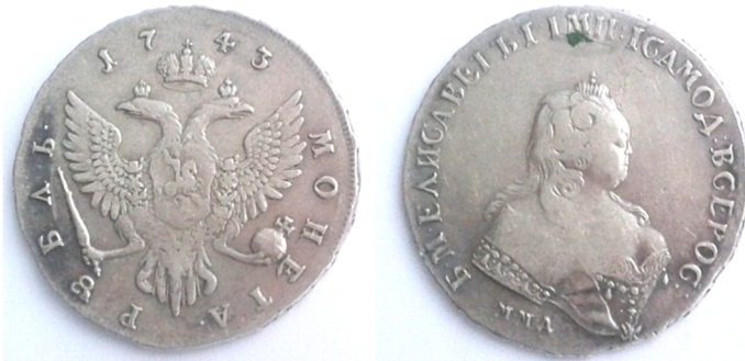
Російська імперія, срібний рубль Єлизавети Петрівни (1741 – 1761), 1743 р.