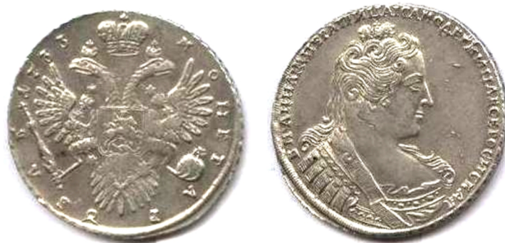
Рубль, Росія, Анна Іванівна (1730 – 1740), 1733 р.