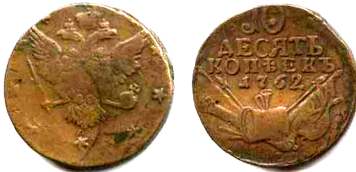
Десять копійок, мідь, Петро III (1761 – 1762), 1762 р.