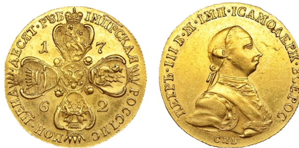
Російська імперія, золотий імперіал (10 рублів) Петра III (1761 – 1762), 1762 р.