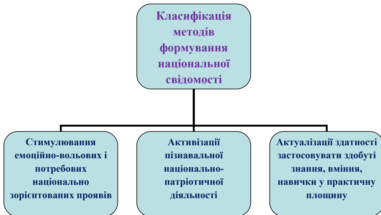
Рис. 2.3.1 Класифікація методів формування національної свідомості третьокласників засобом виховного ідеалу.

третьокласників; актуалізації здатності застосовувати здобуті знання, вміння, навички у практичну площину.